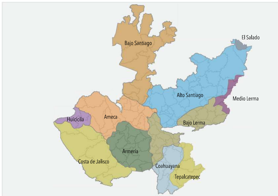
Figura 4.11 Regiones hidrográficas en el estado de Jalisco